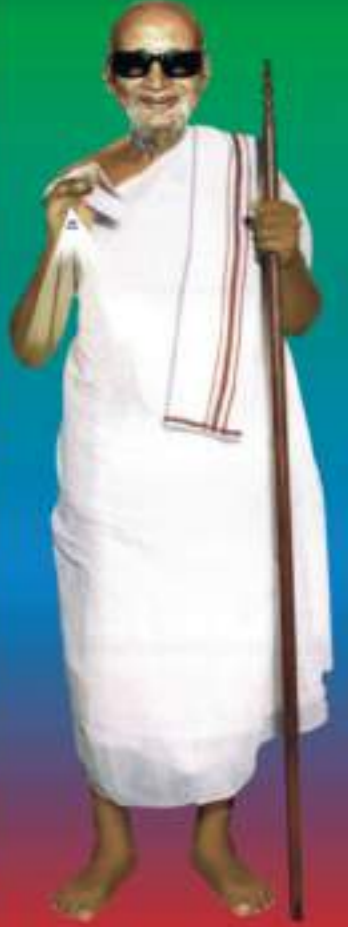
ગુરુજી સમારો સંસ્કરણ. સમને આપો સહાયતા.